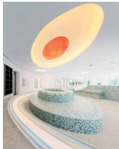
AQUAPANEL מערכת שיפור חזיתות - בית בארבור, תל אביב תכנון: אליקים אדריכלים